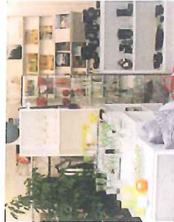
Glimt fra butikken.

Åbent tirsdag-søndag kl. 13-16. (KS alle dage kl. 10-16).