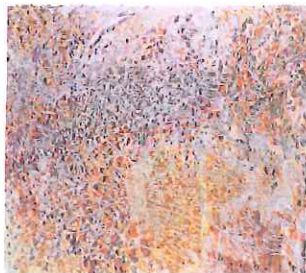
Carsten von Würden

Elevudstilling med fotoarbejder fra BGK, Esbjerg.